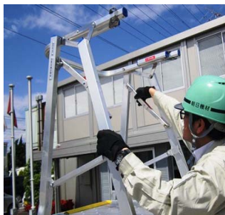
感知枠プレスをロック