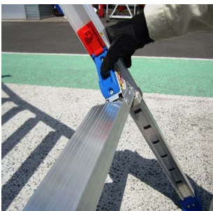
伸縮装置で脚を調整