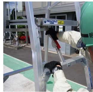
天板プレスをロック