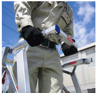
開閉感知装置を開く