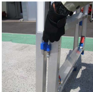
開き止めピンを解除